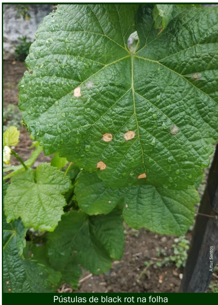
Pústulas de black rot na folha

múltipla, que combatam simultaneamente o black rot.