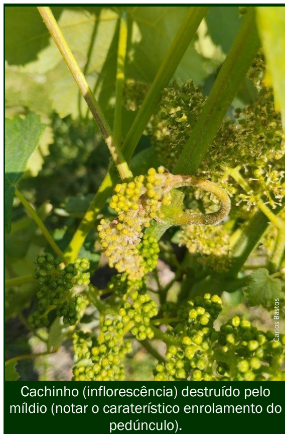
Cachinho (inflorescência) destruído pelo míldio (notar o característico enrolamento do pedúnculo).

Por outro lado, o vento que se tem feito sentir em parte do território da Região, pode contribuir para diminuir a possibilidade de contaminações , sobretudo pelo arejamento suplementar que proporciona à Vinha, mantendo a vegetação enxuta por mais tempo.