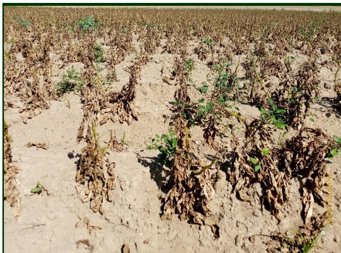
Batatal destruído por ataque de míldio descontrolado

No Modo de Produção Biológico, é autorizada a aplicação de produtos à base de cobre no combate ao míldio da batateira.