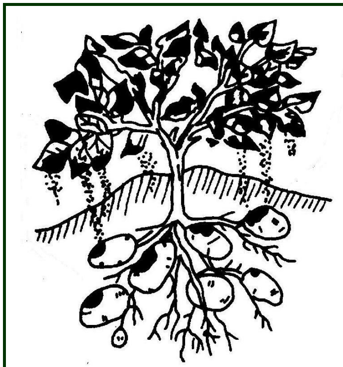
Contaminação dos tubérculos por lixiviação (in La pomme de terre , Rouselle, Robert & Crosnier, INRA, Paris, 1996)

Os ataques de míldio mais tardios podem ocasionar a infeção dos tubérculos na altura da sua completa formação e maturação, levando a perdas durante o armazenamento.