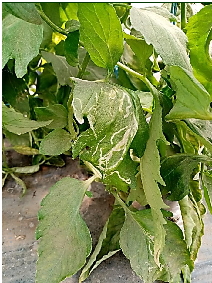
Minas de larvas de Tuta em folhas de tomateiro