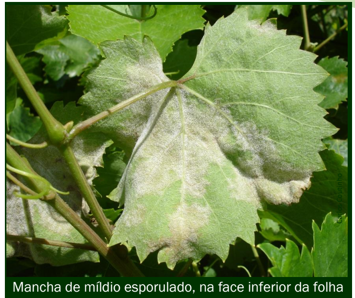
Mancha de míldio esporulado, na face inferior da folha

Algumas medidas preventivas ajudam a controlar e minimizar ataques de míldio ► desponta, desfolha e orientação dos sarmentos (arejamento da folhagem das videiras, exposição dos cachos aos tratamentos) • corte regular da erva espontânea ou dos enrelvamentos • evitar a formação de poças de água na vinha.