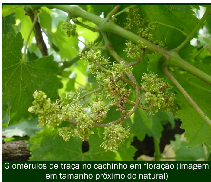
Glomérulos de traça no cachinho em floração (imagem em tamanho próximo do natural)

Não existe risco. Não é necessário tratar.