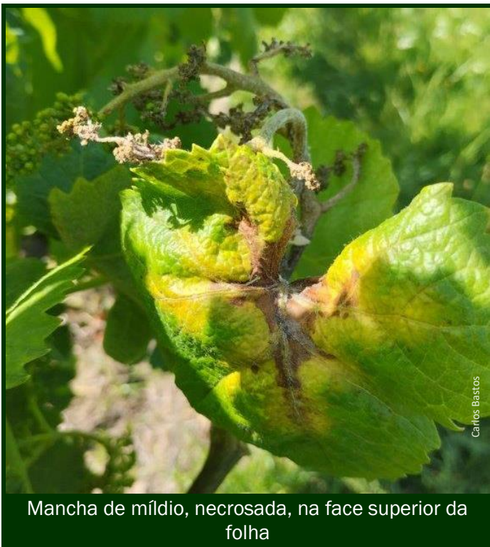
Mancha de míldio, necrosada, na face superior da folha

Os tratamentos devem ser cuidadosamente aplicados ► caldas nas doses e concentrações recomendadas (nem mais, nem menos) ► bicos dos pulverizadores bem regulados ► velocidade adequada do trator ► adaptar o volume de calda a aplicar por hectare , tendo em conta a massa de vegetação da vinha.