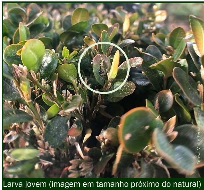
Larva jovem (imagem em tamanho próximo do natural)

Aplique um inseticida homologado , assim que detetar as primeiras larvas da nova geração.