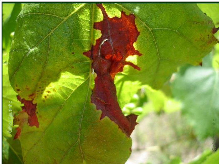
Manchas de Botrytis nas folhas (recorte irregular, cor castanho “marron” característica)

dade das castas e o histórico da vinha ou parcela, aplique um fungicida com ação anti-Botrytis , apenas onde necessário. Pode utilizar um produto de ação polivalente.