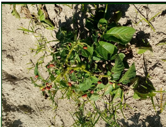
Ataque intenso de escaravelho da batateira

Observe atentamente o batatal. Se encontrar alguns focos localizados, procure aplicar um inseticida apenas nos locais atingidos , caso conclua ser necessário.