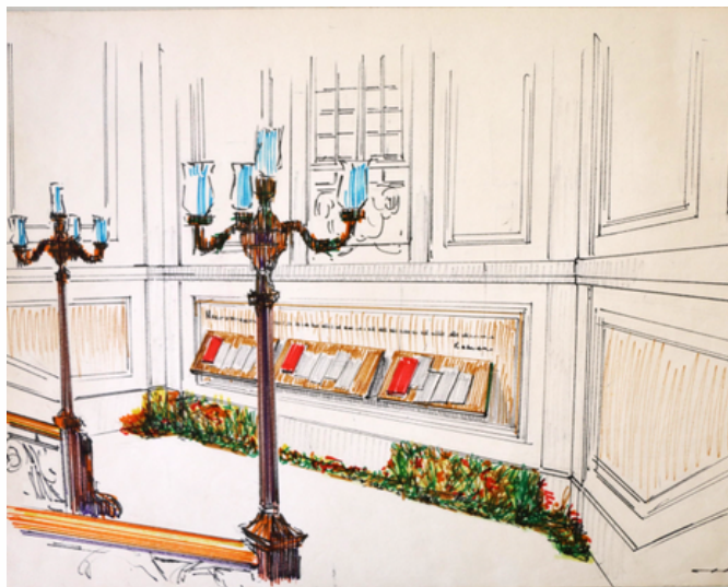
MIRÃO, Joaquim. Desenho da escadaria da sede do Instituto do Vinho do Porto. Exposição Quarenta Anos ao Serviço do Vinho do Porto . 1973.

Instituto do Vinho do Porto, de referência para os diferentes intervenientes do setor e de comunicação promocional junto da sociedade.