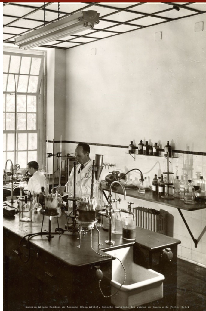
Autoria Álvaro Cardoso de Azevedo (Casa Alva), Coleção Instituto dos Vinhos do Douro e do Porto, I.P. ©