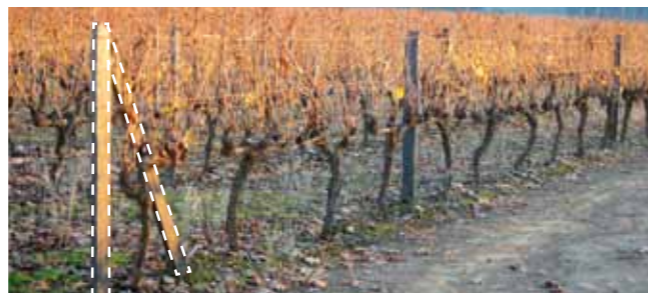
Boa fixação da cabeceira em pedra de xisto com “estronca” que permite manter os arames esticados.

Com uma cabeceira forte, pode usar fios e arames bem esticados para levantar os pâmpanos rapidamente. Facilita a amparar e poupa na mão-de-obra.