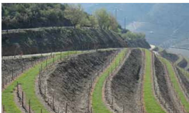
Enrelvamento em patamares.

Na produção integrada os enrelvamentos reduzem o uso de herbicidas.