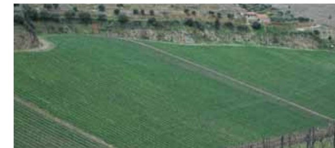
Vinha ao alto.