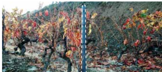
Má fixação da cabeceira em pedra de xisto sem arriosta. Com o tempo inclina e os arames ficam bambos.

O tempo que poupa a compor a vegetação é muito importante, porque os trabalhos em verde têm de ser feitos no tempo certo, a mão-de-obra é cara e cada vez mais difícil de arranjar!