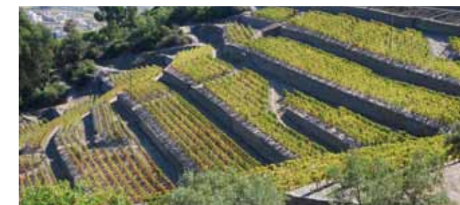
Adaptação de vinhas antigas à mecanização mantendo os muros.

Mesmo que não consiga mecanizar a vinha, procure melhorar o embardamento para facilitar os trabalhos. Poupa tempo – e tempo é dinheiro!