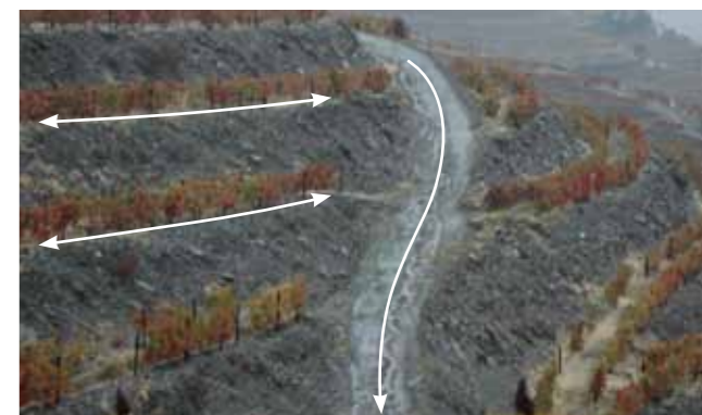
Drenagem incorreta. Patamares horizontais dificultam a saída das águas para o caminho, desviando-as por vezes para os taludes, e faltam manilhas no caminho principal.