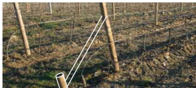
Boa fixação da cabeceira com escora, o que permite uma boa tensão dos arames.

O tempo que poupa a compor a vegetação é muito importante, porque os trabalhos em verde têm de ser feitos no tempo certo, a mão-de-obra é cara e cada vez mais difícil de arranjar!