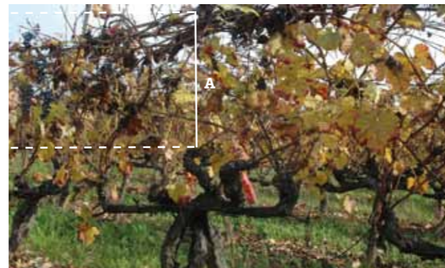
A enrola dificulta retirar a lenha de poda do arame superior. Devido a podas incorretas os braços alongados dos talões diminuem a altura (A) da parede de vegetação.

É frequente fazer a enrola da vinha, mas agora sabe-se que em vinhas mecanizadas a desponta é melhor: facilita os tratamentos e os trabalhos com a poda. Os hábitos também se mudam, desde de que para melhor.