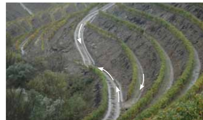
Drenagem correta com manilhas apenas nos caminhos principais e declive longitudinal e lateral nos patamares.