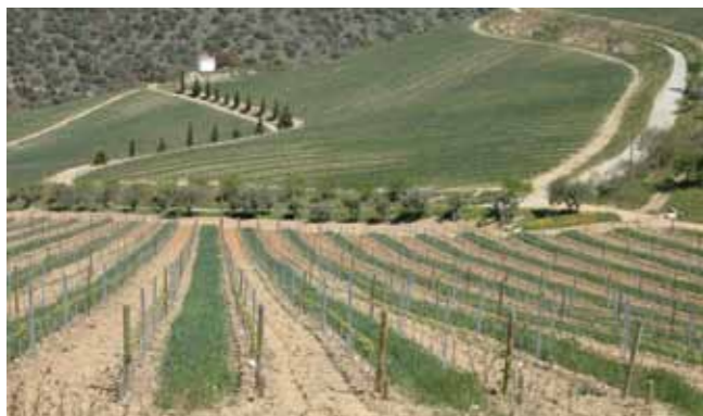
Enrelvamento em vinha ao alto.