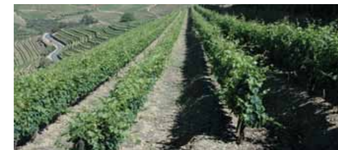
Vinha em patamares estreitos com um só bardo.