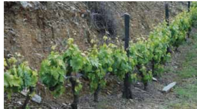
Ocasião adequada para desladrar o tronco e espampar a base dos tomos.

A espampa é muito importante para o controlo das doenças e para a maturação nas vinhas conduzidas em cordão. Espampe o mais cedo possível para poupar trabalho.