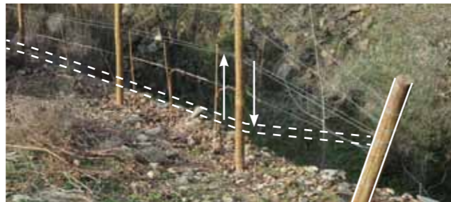
Boa fixação da cabeceira com pau enterrado a 1,20m e arame duplo móvel que facilita levantar os pâmpanos após a rebentação.