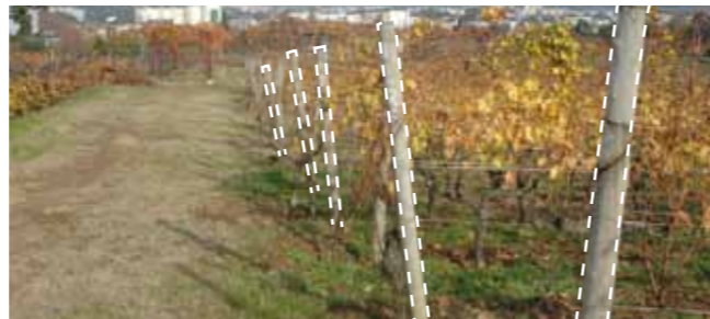
Má fixação da cabeceira. Alguns postes de cabeceira cederam e os arames deixaram de estar esticados.