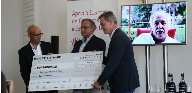
viver o porto