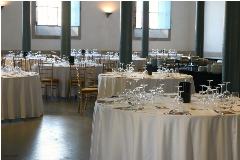
viver o porto

a solidarity moment, where a cheque in the amount of 100.000 euros was given to Bagos de Ouro Association, an association supporting children in need from the Douro region. the amount was gathered by the Port Project (O - Port- Unidade)