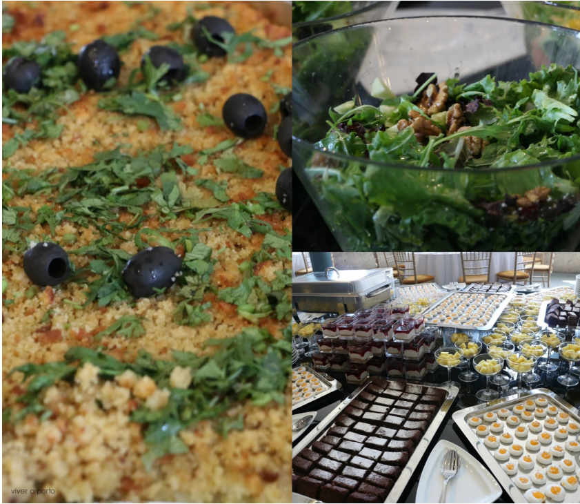
Silva Carvalho catering