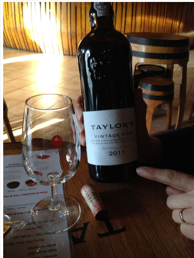
Vinho do Porto Taylor's