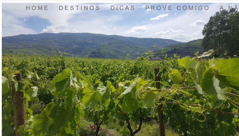
Vinhas da Quinta da Pacheca

No programa “Experience Port Wine” vai poder contar com jantares vínicos, harmonizações gastronómicas com Vinho do Porto, cocktails, montras decoradas, programas especiais nas caves e museus.