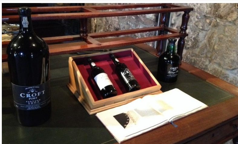
Caves de vinho do Porto Croft