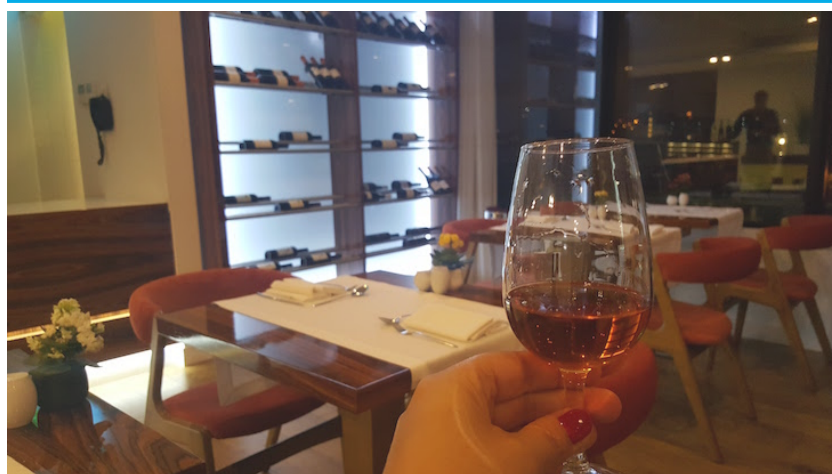
Vinho do Porto @ Viaje Comigo