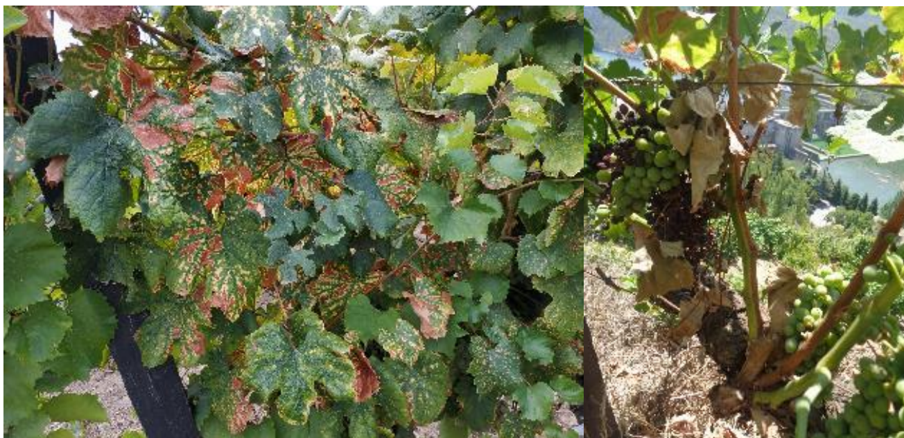
Sintomas de Escalada na Folha.