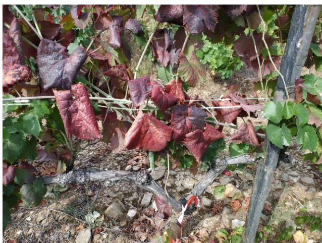
Videira com sintomas de Flavescência Dourada

Deverá ser guardado um registo da data da realização do tratamento, do produto utilizado e da dose aplicada, para efeitos de futuro controlo.