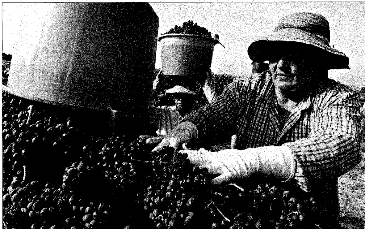
NACIO ROSA LUSA

▲ A BEBIDA ESPRITUOSA DO DOURO TAMBÉM GANHA TERRENO NO MERCADO ESPANHOL