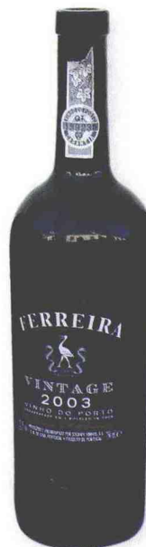
Ferreira Porto Vintage 2003