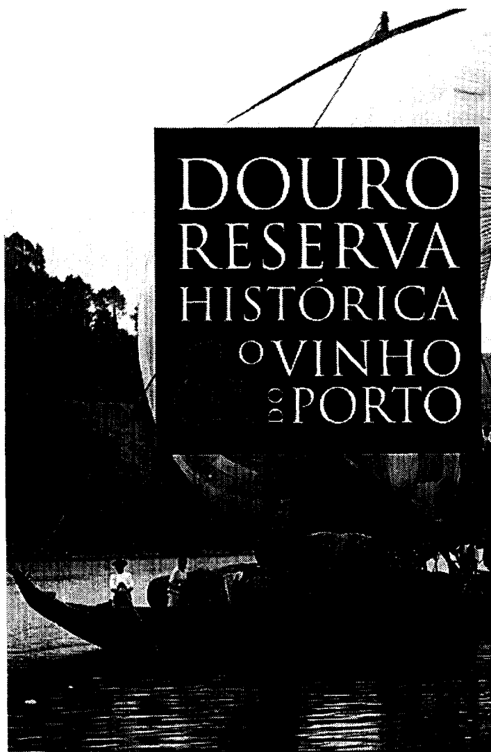
Imagem do catálogo da exposição