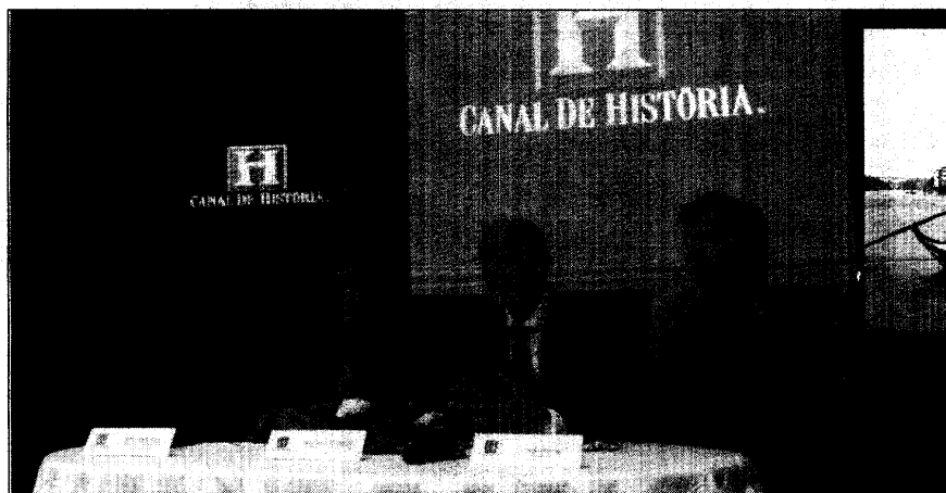
DOCUMENTÁRIO invoca uma visão histórica e cronológica da evolução da produção e comercialização.

“Vinho do Porto” coproduzido pelo Canal de História e Connect Internacional, invoca uma visão histórica e cronológica da evolução da produção e comercialização, assim como as dificuldades encontradas por produtores ao longo dos séculos, examinando ao pormenor a sua riqueza histórica, o singular encanto paisagístico e a reconheci-